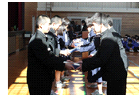
生徒会ファイルとノートを引き継ぎました。同時に先輩方の熱い思いも引き継ぎます。